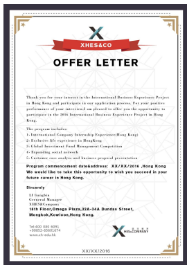
英文版录取通知书

(3) 面试通过者，香港信华工作人员会在当天发出电子版录取通知书，并在接下来的5个工作日内向同学寄发录取通知书和专用收费凭证；