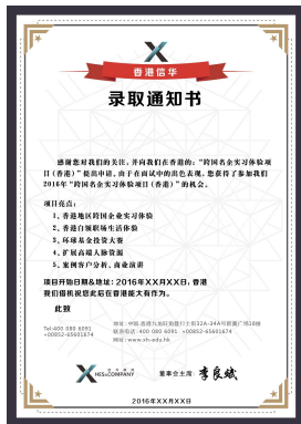
中文版录取通知书